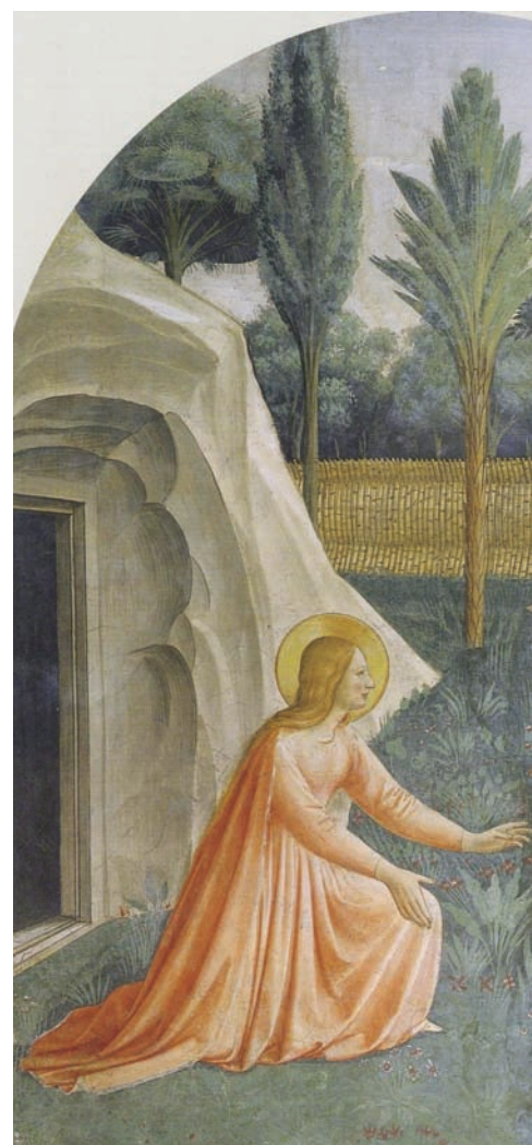
Noli me tangere , détail de l'Apparition du Christ à Marie-Madeleine (cellule n°1)