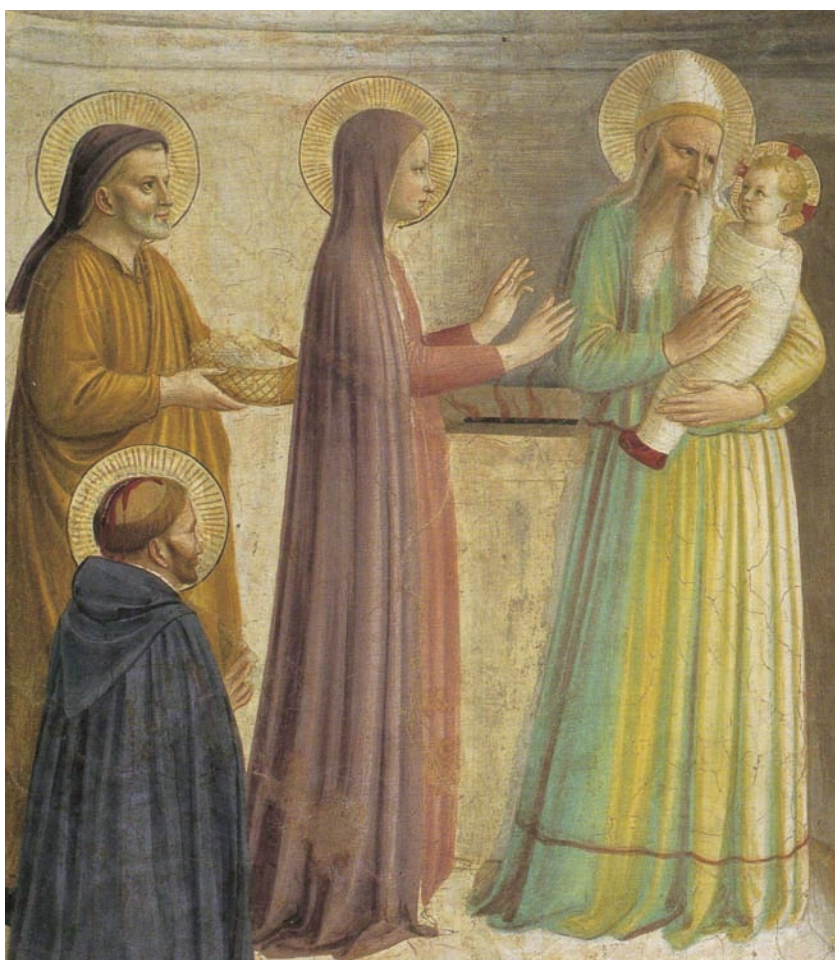
Présentation de Jésus au Temple, avec le vieillard Siméon, Marie et Joseph, saint Dominique agenouillé (cellule n°10)