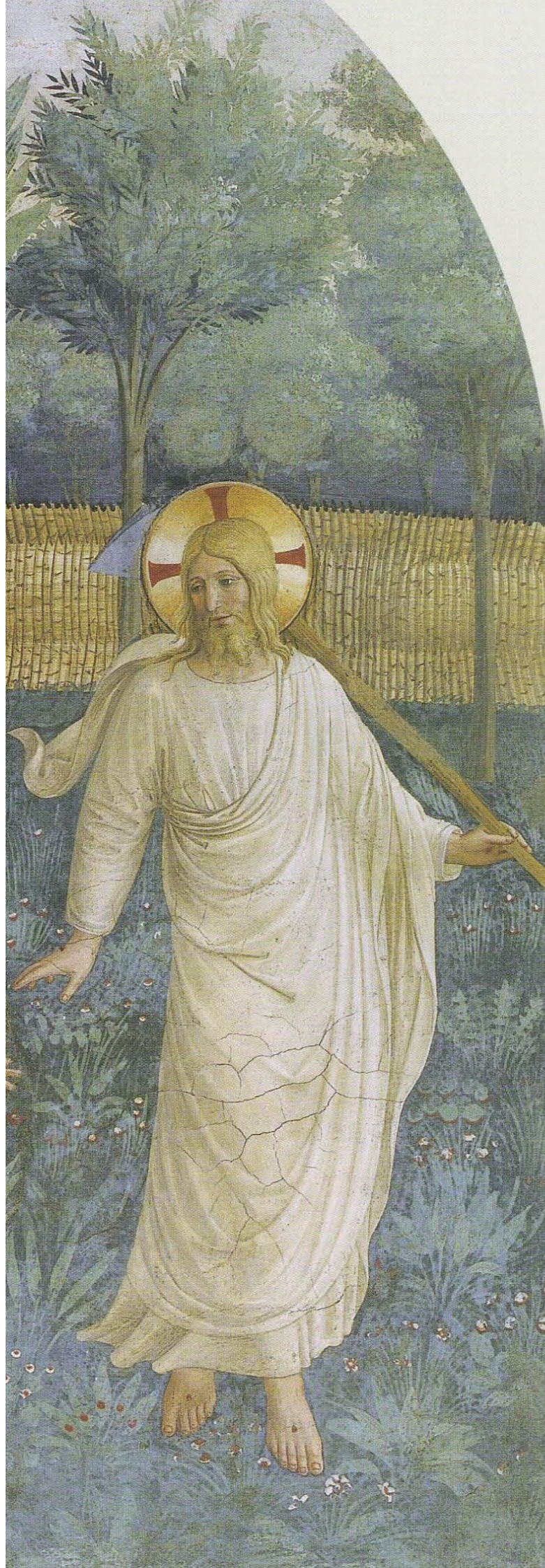
Image page précédente : L'Annonciation (cellule n°3) Ci-contre : Noli me tangere , détail (cellule n°1)

tél. 01 40 47 58 90 - arslatina@gmail.com