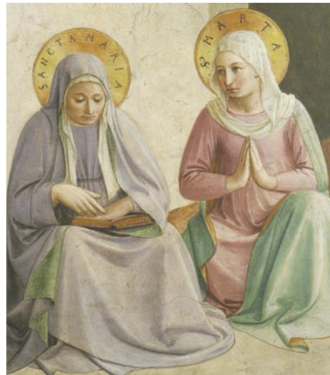
Le Jardin des oliviers, détail de Marthe et Marie (cellule n° 34)