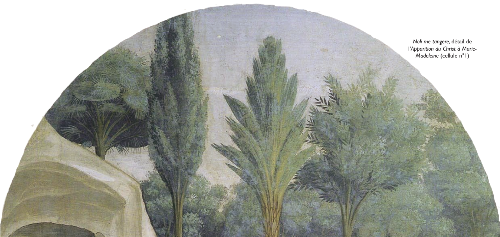
Noli me tangere , détail de l'Apparition du Christ à Marie-Madeleine (cellule n°1)