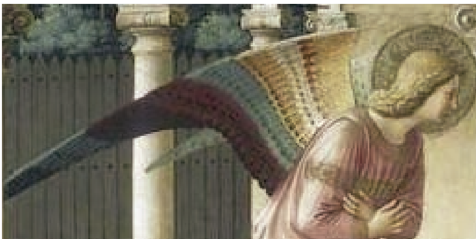
L'Annonciation, détail (corridor)