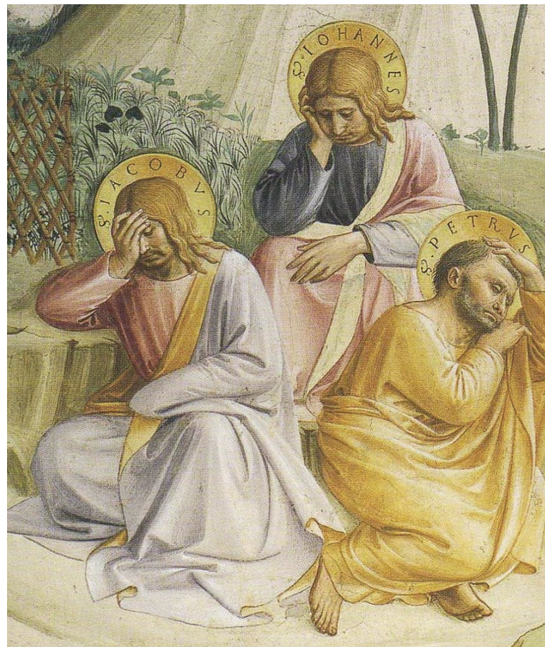
Prière de Jésus au jardin des oliviers, détail des disciples Pierre, Jacques et Jean endormis (cellule n°34)