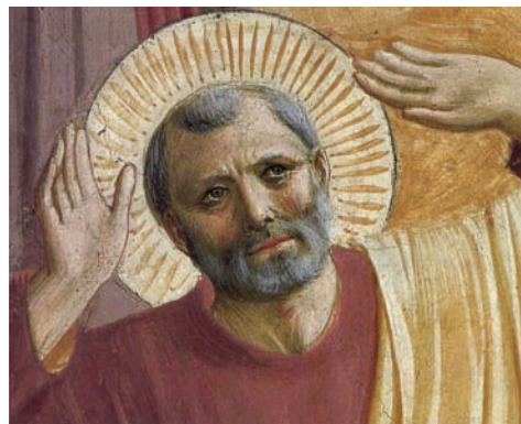
La Transfiguration, détail de Pierre (cellule n° 6)